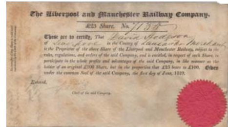
Die Eröffnung der Liverpool and Manchester Railway markierte den Beginn einer Eisenbahn-Euphorie

Ins 19. Jahrhundert fielen die „Flegeljahre“ der Aktiengesellschaft, die durch ihren ungestümen Kapitalismus, die Boomphasen des Eisenbahnbaus und der Gründerzeit mit den jeweils anschliessenden Krisen in Erinnerung geblieben sind. Es war ein Jahrhundert des Aufbruchs, aber auch der hemmungslosen Spekulation. Dennoch wurden in jenen Jahren bereits die Grundsteine grosser, heute multinationaler Unternehmen gelegt.