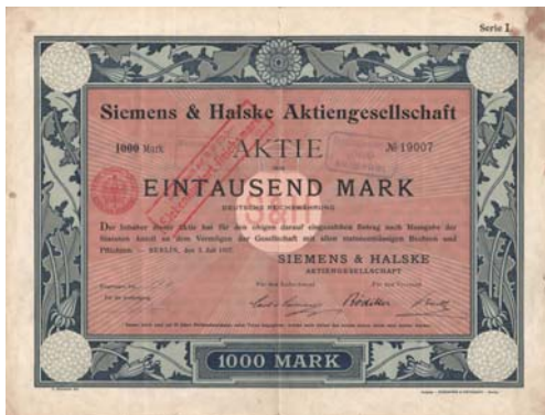
Von der Telegraphenbauanstalt zum Weltunternehmen: Die Firma Siemens & Halske wurde 1897 zur Aktiengesellschaft.