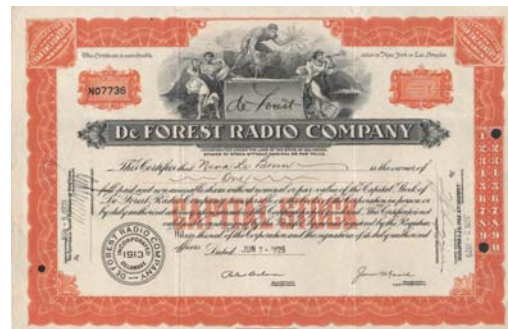
In den 1920er Jahren zählten Aktien von Rundfunkanstalten, wie die De Forest Radio Company, zu den beliebtesten Spekulationsobjekten der Börsianer.

Im 20. Jahrhundert folgten weitere „Karriereschritte“, aber auch „-knicke“. Die Aktie und mit ihr die Börse hatte sich als unverzichtbare Finanzierungsquelle des Fortschritts etabliert. Aktien der neuen Kommunikations- und Transportmittel waren zu Beginn des Jahrhunderts heiss begehrt – ähnlich wie die Internetaktien an dessen Ende.