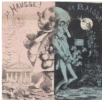
Titelblatt der Satirezeitschrift „La Lune“ vom 16. September 1866.

Selbst wenn zu allen Zeiten Glücksritter auf der Suche nach dem schnellen Geld das Börsengeschehen beeinflussten und das ganze Gefüge ins Wanken brachten, ist die Geschichte der Wertpapierbörse keinesfalls nur eine Crash-Geschichte – obwohl die Crashes der Börse immer wieder die grössten Schlagzeilen eintrugen. Die Auswahl und Zusammenstellung der Exponate zeigt ein ausgeglichenes Bild zwischen den „Hits und Flops“ der Börsengeschichte. Im Spannungsfeld zwischen Wagemut und Gier, Pioniergeist und Betrug, Erfindungsreichtum und Unvermögen kommen alle zu Wort.