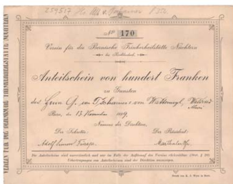
Auch der Verein der Bernischen Trinkerheilstätte Nüchtern gab Anteilscheine heraus.

Einen Teil des breiten Spektrums der Wirtschaftsgeschichte bilden der im 19. Jahrhundert aufkommende Tourismus, das Handwerk und die soziale Situation der arbeitenden Bevölkerung. Während in mondänen Ferienorten die Hotelgäste mit modernsten Einrichtungen verwöhnt wurden, war die Wohn- und Ernährungssituation der Arbeiterfamilien in den industriellen Zentren teilweise desolat. Dem sozialen Problem des grassierenden Alkoholismus nahmen sich Vereine und Heilstätten an, die zu ihrer Finanzierung ebenfalls Anteilscheine herausgaben. Der Erfolg der Pioniere der Nahrungsmittelindustrie Henri Nestlé und Julius Maggi gründete auf ihrer Erfindung nährstoffreicher Fertigprodukte, die zur Verbesserung der Volksgesundheit beitrugen. Heute ist Nestlé der grösste Nahrungsmittelkonzern der Welt.