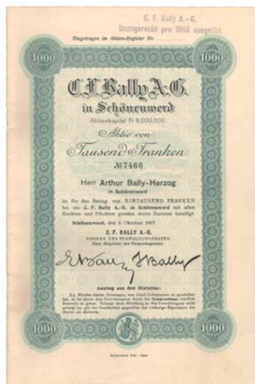
C.F. Bally schaffte den Aufstieg vom Hosenträgerfabrikant zur Weltmarke.

Unter dem Motto „Tradition und Innovation“ folgt die Ausstellung anhand von Aktien und Anleihen den Spuren der Industrialisierung in der Schweiz. Vom frühen 19. Jahrhundert, als die ersten Aktiengesellschaften in der Industrie entstanden, über die Gründerzeit, in der kleine Handwerksbetriebe mit einer zündenden Geschäftsidee zu Fabriken mutierten und grossartige Infrastrukturprojekte das Land veränderten, bis zu den Finanz-, Chemie- und Hightech-Unternehmen unserer heutigen Zeit spannt sich der abwechslungsreiche Bilderbogen der