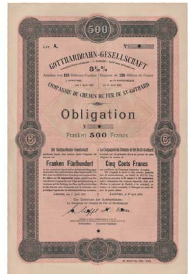
Die Eröffnung der Gotthardbahn im Jahr 1872 war ein Meilenstein der Schweizer Verkehrs- und Wirtschaftsgeschichte.

Naturgegebenheiten wie Rohstoffarmut und schwierige geografische Verhältnisse beeinflussten die Energiewirtschaft und den Ausbau des Verkehrsnetzes – und forderten von den Schweizer Unternehmern immer wieder unkonventionelle, innovative Lösungen. Der Siegeszug der Eisenbahn fand seinen Höhepunkt im Bau der Gotthardbahn, die vor genau 125 Jahren eröffnet werden konnte. Mit dem Bau der ersten Zahnradbahn Europas betraten Schweizer Ingenieure Neuland. Weniger bekannt sind die heimischen Automobilhersteller. Auch Lastkraftwagen und Motorräder wurden hier gebaut: Die Aktien von Martini, Berna und Motosacoché geben davon Zeugnis. In der Energiewirtschaft waren Wasserkraft und eine frühzeitige Elektrifizierung die Antwort auf den Mangel an Kohle und anderen fossilen Energieträgern. Auch über diese Entwicklung geben die ausgestellten Wertpapiere einen umfassenden Überblick.