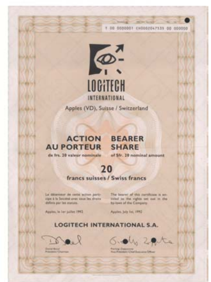
Schweizer Hightech-Produkte eroberten die Welt – wie die Computermäuse von Logitech.