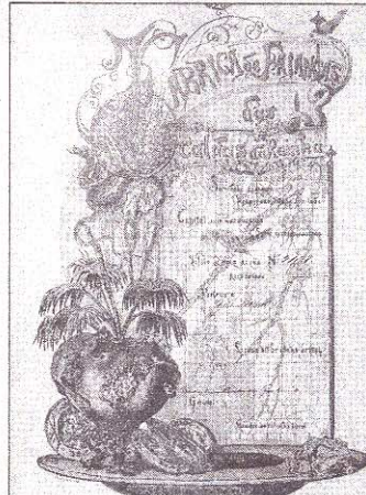
Meisterwerk Diese portugiesische Elffarben-Lithographie aus dem Jahre 1884 gilt als eine der schönsten Aktien der Welt.