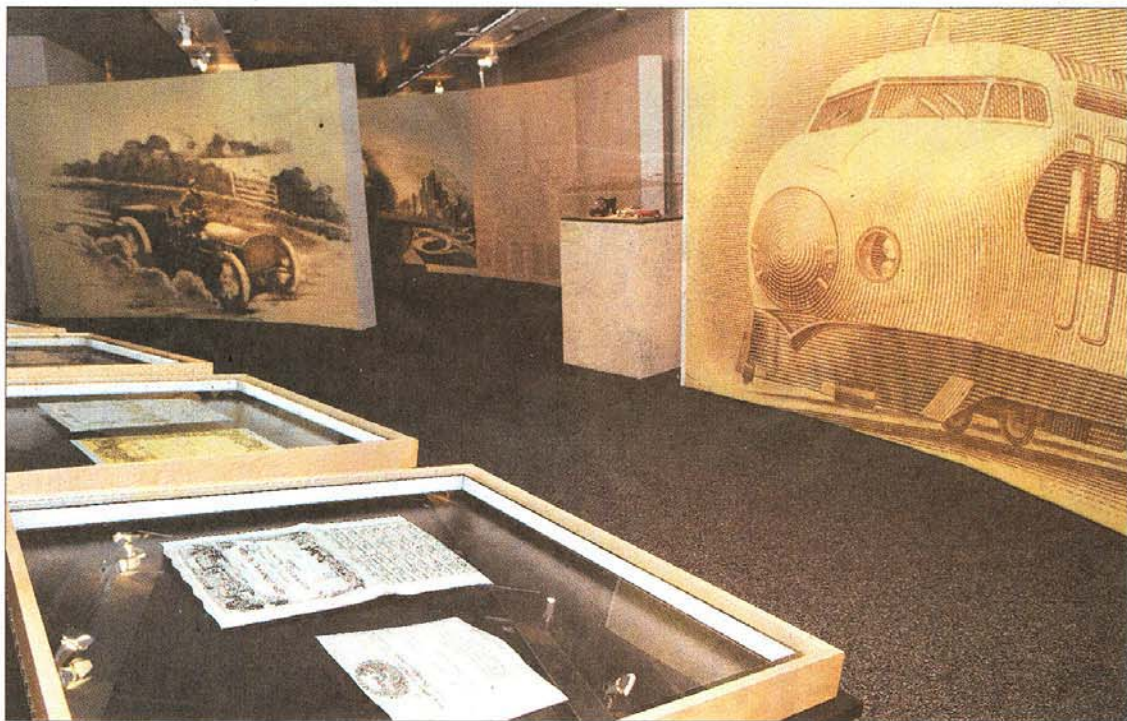
MOBILITÄT Die ausgestellten Wertpapiere sind mit Modellen aus dem Verkehrshaus Luzern ergänzt. sxo