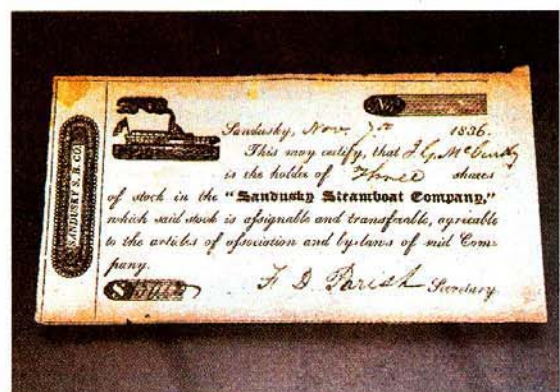
VIELSEITIG Ob Rigi- und Centralbahn, Schiffahrtsgesellschaft oder Swissair: Der Wandel der Mobilität spiegelt sich in den Aktien.