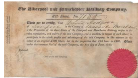
L'ouverture de Liverpool and Manchester Railway marque le début de l'euphorie ferroviaire.

Le 19 ème siècle a été marqué par les années d'insouciance de la société anonyme, années gravées dans la mémoire en raison d'un capitalisme fougueux, de l'expansion fulgurante du chemin de fer et de la période des fondateurs avec les respectives crises qui s'ensuivirent. Il s'agissait là d'un siècle placé sous le signe des avancées, mais aussi celui de la spéculation effrénée. Néanmoins, c'est à cette époque que les premières pierres des grandes multinationales d'aujourd'hui ont été posées.