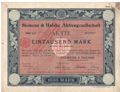
De l'établissement de construction de télégraphes à l'entreprise mondiale. En 1897, la société Siemens & Halske devient une société par actions.