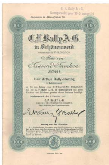
Fabricant de bretelles, C.F. Bally s’est imposé comme une marque mondiale.

Sous la devise « Tradition et innovation », l’exposition retrace au travers des actions et des obligations l’histoire de l’industrialisation de la Suisse. Multiples et variés, les titres exposés couvrent la période allant du début du 19 ème siècle, moment de l’apparition des premières sociétés par actions, jusqu’aux entreprises financières, pharmaceutiques et high-tech, en passant par le temps des pionniers durant lequel de petites manufactures – grâce à une idée révolutionnaire – se sont transformées en usines modernes et des projets d’infrastructure spectaculaires