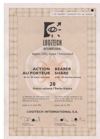
Les produits high-tech suisses ont conquis le monde – comme p.ex. la souris de Logitech.