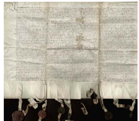
Dès 1545, des commerçants de différentes villes suisses commencent à prêter de l'argent à l'étranger.

Le commerce extérieur était jadis aussi important qu'aujourd'hui, car il fallait importer les matières premières et commercialiser les produits industriels sur des marchés étrangers. Le papier-valeur le plus ancien de l'exposition montre à quelle lointaine époque remonte le vaste réseau international des commerçants: il s'agit d'un contrat obligataire passé entre des commerçants suisses et des nobles de Haute-Savoie en 1545. Aujourd'hui encore, une grande partie de la production suisse s'exporte tandis que les grands magasins helvétiques proposent des produits provenant du monde entier.