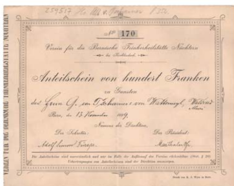
L'association Bernische Trinkerheilanstalt Nüchtern a également émis des actions.

Le tourisme naissant, l'artisanat et la situation sociale de la population ouvrière s'inscrivent dans le paysage diversifié de l'histoire économique du 19 ème siècle. Tandis que des gens aisés jouissaient des infrastructures modernes et confortables des hôtels dans des lieux de vacances mondains, les conditions de logement et d'alimentation de certaines familles ouvrières dans les centres industriels étaient extrêmement précaires. Des associations et lieux de cure s'attelèrent au problème aigu de l'alcoolisme; pour se financer, elles émirent également des actions. Henri Nestlé et Julius Maggi, pionniers de l'industrie agro-alimentaire, doivent leur succès à l'invention de produits nutritifs prêts à consommer qui contribuèrent à l'amélioration de la santé publique. Aujourd'hui, Nestlé est le numéro un mondial de l'agro-alimentaire.