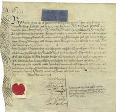
Mercy & Irwell Canal von 1724 Handgeschrieben auf Pergament und mit Siegeln versehen: ein kalligrafisches Meisterwerk.

Die Ausstellung nimmt Sie mit auf einen stilgeschichtlichen Streifzug durch die Welt der Wertpapiere. Waren die ersten Aktien und Anleihen noch kalligrafische Meisterwerke, die mit grosser Sorgfalt individuell angefertigt wurden, erkannten die Emittenten schon bald die Werbewirkung eines dekorativen Aktienzertifikats. Kunstvolle Kupfer- und Stahlstiche, Lithografien und alle erdenklichen Mischtechniken prägten das Wertpapierdesign der einzelnen Epochen. Immer wieder griffen die Illustratoren die stilistischen Vorlieben ihrer Zeit auf: Romantik und Historismus, die rauchenden Schloten der Gründerzeit und, den Zeitgeist spiegelnd, schmückten Jugendstilgrazien die prachtvollen Zertifikate.