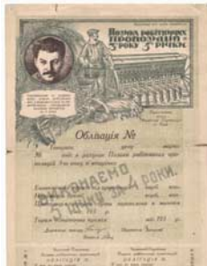
Das Porträt Stalins auf dieser Anleihe aus den 1930er Jahren sollte für die Sowjetregierung den Rubel rollen lassen.

Nicht selten zieren die Konterfeis historischer Persönlichkeiten Aktien und Anleihen. Dies, um beim Investor Vertrauen in ein Produkt zu erwecken, wie das Bildnis Gutenbergs auf der Aktie einer Druckerei oder dasjenige Stradivaris auf dem Anteilsschein eines Instrumentenbauers. Das Konterfei ist jedoch ebenso Ausdruck eines Personenkults, wie die Porträts Saddam Husseins und Josef Stalins auf Staatsanleihen veranschaulichen.