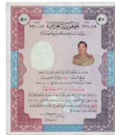
Auch Saddam Hussein liess sich auf irakischen Staatsanleihen verewigen. In diesem Fall auf einer Anleihe aus dem Jahr 1986, ausgegeben zur Finanzierung des Kriegs gegen den Iran.

Oftmals kann keine klare Grenze zwischen Kulturschaffenden, Erfindern und Industriellen, Spekulanten und Bankiers gezogen werden. Die Ausstellung will Zusammenhänge aufzeigen und grosse Persönlichkeiten vergangener Tage wieder zum Leben erwecken. Lassen Sie Sich von Maria Theresia oder John D. Rockefeller aus ihrem Leben erzählen. Adel und Geldadel, grosse Erfinder und begnadete Finanziere begegnen Ihnen in der Ausstellung. Letztlich war es der Mensch, der durch seine Innovationskraft die Welt in den vergangenen 400 Jahren nachhaltig verändert hat. Die Aktie war das Vehikel dazu – und immer auch Ausdruck der Macht und des Reichtums ihrer Besitzer.