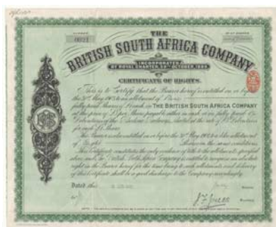
The British South Africa Company Mit Hilfe der "British South Africa Company" nahm Cecil Rhodes Nord- und Südrhodesien in Besitz.

Afrika betritt erst im Zeitalter des Imperialismus die Bühne der Weltwirtschaft, als die europäischen Staaten dort ihre Kolonien errichteten. Zur Erschliessung des Kontinents und Ausbeutung des natürlichen Reichtums wurden unzählige Aktiengesellschaften gegründet. Vom Suezkanal im Norden bis zu den Diamantminen im Süden des Kontinents geht die Reise durch die Wirtschaftsgeschichte Afrikas. Oftmals war es nicht nur der Profit, sondern vor allem auch die Politik, wodurch die Entwicklung dieser Gesellschaften und damit ganzer Landstriche nachhaltig beeinflusst wurde. Ein Beispiel dafür ist die von Cecil Rhodes gegründete "British South Africa Company", mit der er grosse Gebiete im südlichen Afrika für die englische Krone in Besitz nahm und sie ganz bescheiden "Rhodesien" nannte.