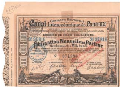
Compagnie Universelle du Canal Interoceanique de Panama Das Kanalbauprojekt des Franzosen Ferdinand de Lesseps scheiterte kläglich und führte zu einem finanziellen Debakel.

Die Wertpapiere Süd- und Mittelamerikas erzählen von frühen Kolonien, reichen Bodenschätzen und tropischen Plantagen, aber auch von dem grossen Desaster der Franzosen beim Bau des Panamakanals. Auch hier lässt sich die Wirtschaftsgeschichte eines ganzen Kontinents auf Wertpapieren dokumentieren.