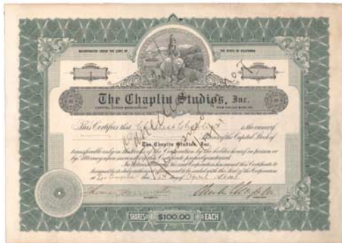
The Chaplin Studios Gründeraktie Nr. 1 der Chaplin Studios. Unterschrieben von Charlie Chaplin persönlich, als in Hollywood die Bilder laufen lernten.

Die Wertpapiere Süd- und Mittelamerikas erzählen von frühen Kolonien, reichen Bodenschätzen und tropischen Plantagen, aber auch von dem grossen Desaster der Franzosen beim Bau des Panamakanals. Auch hier lässt sich die Wirtschaftsgeschichte eines ganzen Kontinents auf Wertpapieren dokumentieren.